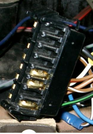
Stecker X9 Kadett E LCD schwarz